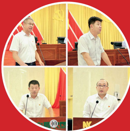
⑧ 研讨班现场 ⑨ 宣讲会现场 ⑩ 部分单位和部门干部交流发言

调,下一步,要以习近平新时代中国特色社会主义思想为指导,认真学习贯彻习近平总书记“七一”重要讲话精神和视察宁夏重要讲话精神,认真贯彻落实习近平总书记关于国有企业党的建设、高质量发展、农垦改革发展等重要论述,跳出农垦看农垦,站在全局干农垦。