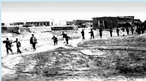
浙江支宁青年上工场景