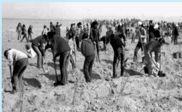
农田基本建设会战场景