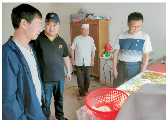
(作者为农垦集团派驻西吉县沙沟乡东沟村第一书记)